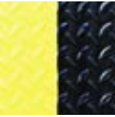
Yoga Deck Signal® mit dem gelben Seiten- streifen.

Yoga Deck® gehört zu den qualitativ besten Miltex-Matten. Sie hat eine außergewöhnlich strapazierfähige Oberfläche und ist daher gegenüber ungünstigen äußeren Einflüssen bestens gewappnet. Der Belag ist beständig gegen die meisten Industrieöle und -chemikalien und seine geriffelte, porenfreie Oberfläche ermöglicht eine problemlose Reinigung. Durch die robuste Oberfläche ist der Belag auch nach jahrelanger Beanspruchung noch voll funktionsfähig.