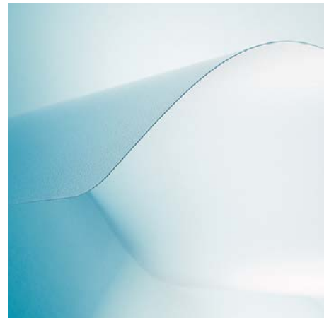
Für Hartböden mit VAB®-Haftschicht