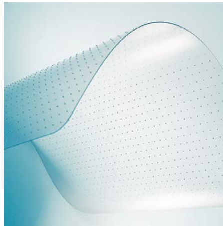
Für Teppichböden mit Ankernoppen

Der Bürostuhl gleitet perfekt – sowohl über Hartböden als auch Teppichböden. Die leistungsstarke, thermisch-verschweisste VAB®-Haftschicht sorgt auf Hartböden dafür, dass ein Verrutschen der Matte ausgeschlossen ist. Auf Teppichböden sorgen stumpfe Ankernoppen für Halt, die in den weichen Flor greifen.