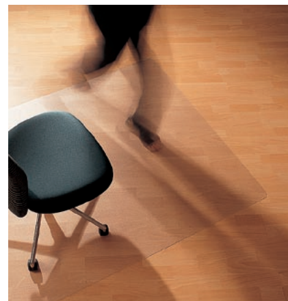
Ecogrip® Serie 12 mit Haftschrift

Mattenstärke: 1,8 mm, Noppenlänge: 4,5 mm.