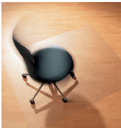
Ecogrip® Serie 11 mit Ankerknoppen

Ecogrip® wird aus Makrolon® gefertigt. Dieser hochwertige Werkstoff ist absolut schlag- und bruchfest und gewährleistet eine außergewöhnlich lange Nutzungsdauer. Außerdem ist Makrolon® zu 100 % recyclebar und bewirkt somit auch einen sparsamen Umgang mit allen zur Herstellung notwendigen Ressourcen.