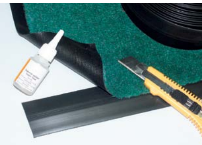
Randanbringung bei Rollenware möglich